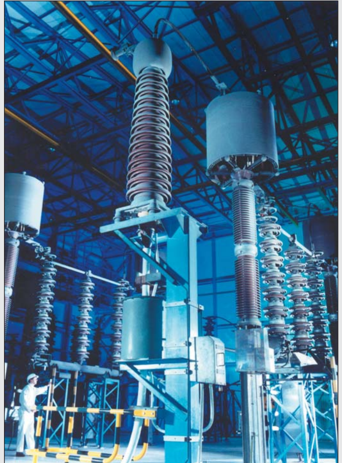
Central eléctrica (Peterhead CS)

Cermet II es la solución tanto para la gestión energética como de control de calidad en el suministro de gases y aire comprimido desde secadores de adsorción de regeneración de calor. La durabilidad del sensor cerámico avanzado de humedad garantiza un servicio de larga duración en aplicaciones como el secado de tuberías con vacío y técnicas de purgado de gas seco.